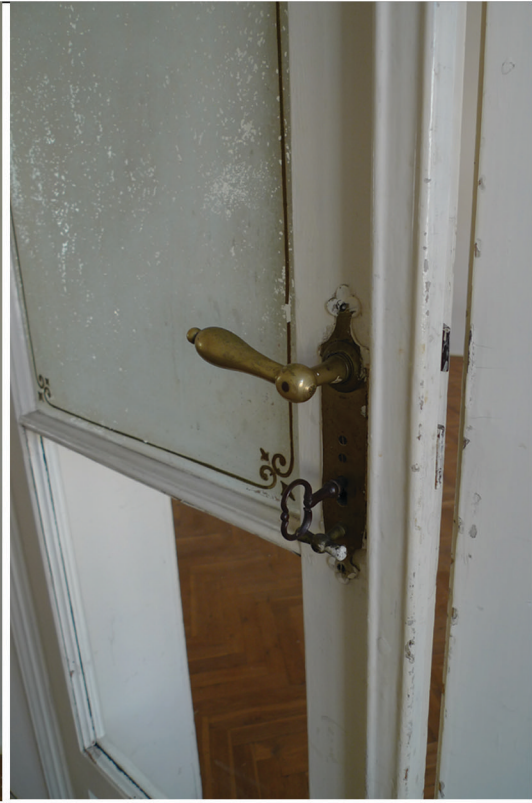
D/4 detail kování

D/4 Velikost 1200 x 2150 Vnitřní dveře dvoukřídle, prosklené, dřevěné, kazetové Zasklení - sklo čiré ornamentální Zárubeň - dřevěná obložková s dochovanou dobovou profilací Povrchový úprava - nátěr bílý Kování - panty jsou původní, zámek klika klika původní