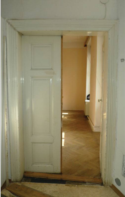
D/5 pohled z koupelny

D/2 Velikost 1210 x 2150 Vnitřní dveře dvoukřídle, dřevěné, kazetové Zárubeň - dřevěná obložková s dochovanou dobovou profilací Povrchový úprava - nátěr bílý, Kování - panty jsou původní, zámek klika klika původní